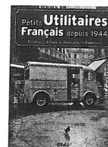
« Petits utilitaires français depuis 1944 », François Allain et Dominique Pagneux, éditions Etai, 2004

Privilégiée par l'administration (Postes...), la fourgonnette 2CV circule aussi bien sur les routes que sur les chemins, dans les rues comme dans les champs. Près de 1 250 000 exemplaires de cette voiture passe-partout seront assemblés par Citroën entre 1951 et 1981.